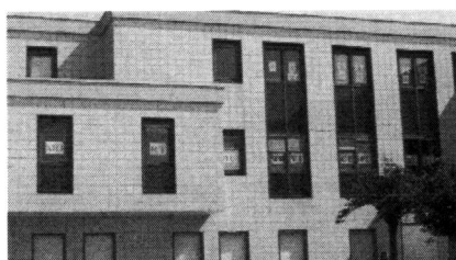
Bressuire : la restructuration des finances publiques fait débat