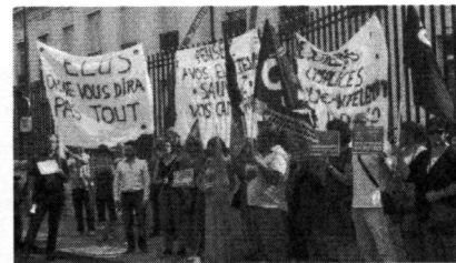
Réforme des finances publiques : les élus de l'Indre interpellés devant la préfecture