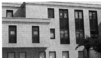
Bressuire : la restructuration des finances publiques fait débat