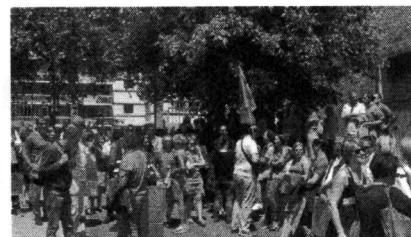
Tours : 250 agents des impôts manifestent contre les fermetures de trésoreries