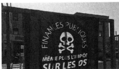
Bressuire : le personnel des Finances publiques est en grève